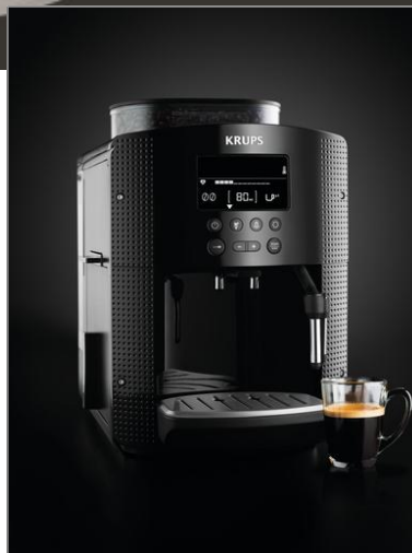
ESSENTIAL DISPLAY EA815 Essential Display Noir EA815070